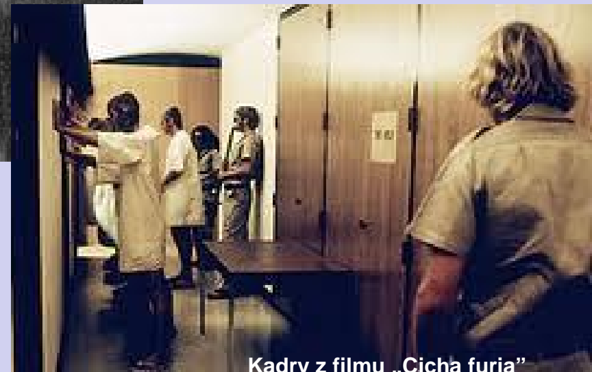
Kadry z filmu „Cicha furia”